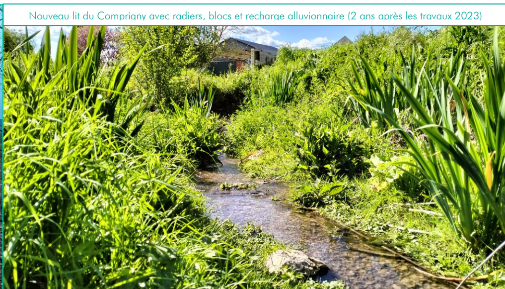
Nouveau lit du Comprigny avec radiers, blocs et recharge alluvionnaire (2 ans après les travaux 2023)