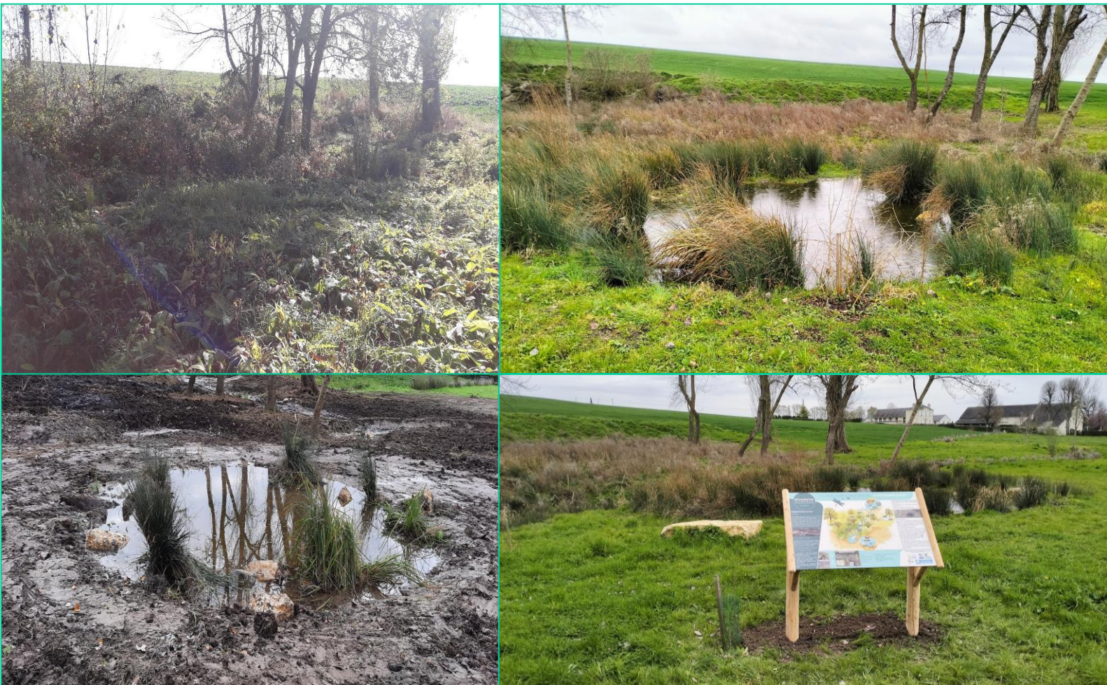
Création d'une mare et sa valorisation

Agence de l'Eau Loire-Bretagne 50%, Région Centre Val de Loire 20%, Syndicat des Bassins du Négron et du Saint-Mexme-Vienne aval et affluents (SBNM) 20%, Conseil Départemental d'Indre et Loire 10%.